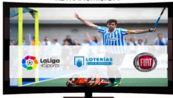
CARETAS DE ENTRADA Y SALIDA RETRANSMISION