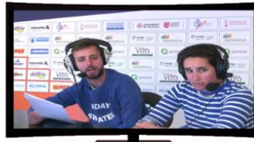
CABINA LOCUCION CON TRASERA