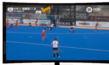
PATROCINIO ULTIMO MINUTO