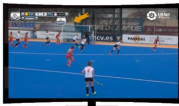
PATROCINIO RESULTADO DEL PARTIDO