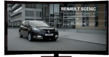
SPOTS PUBLICITARIOS EN MEDIA PARTE