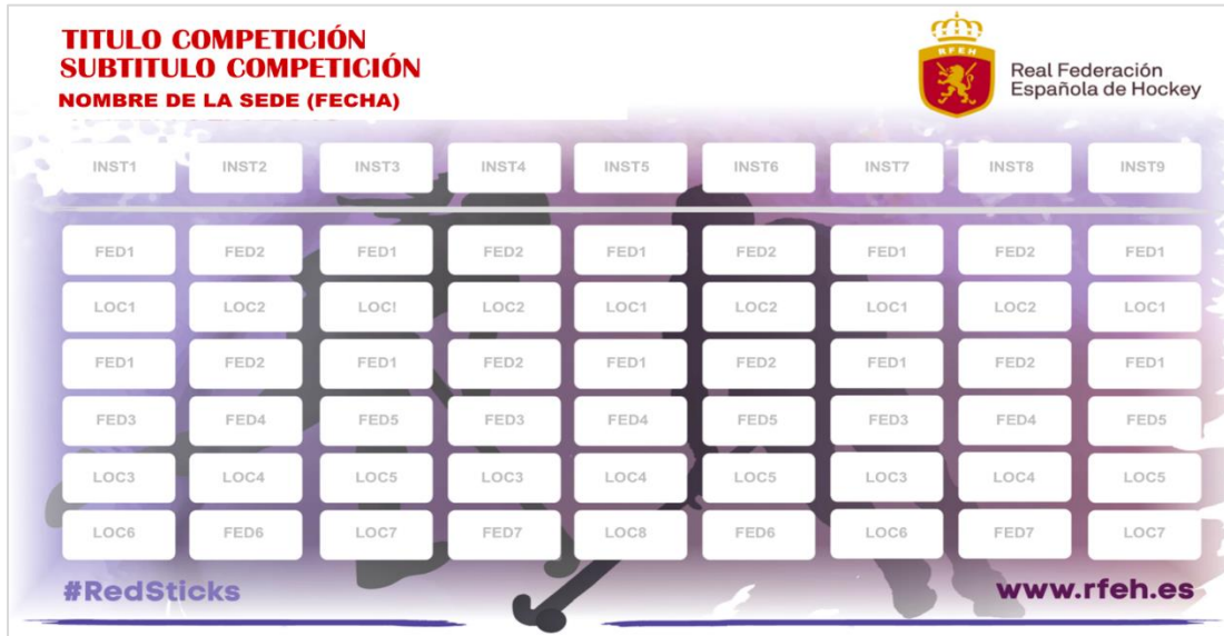
Photocall (diferentes formatos)